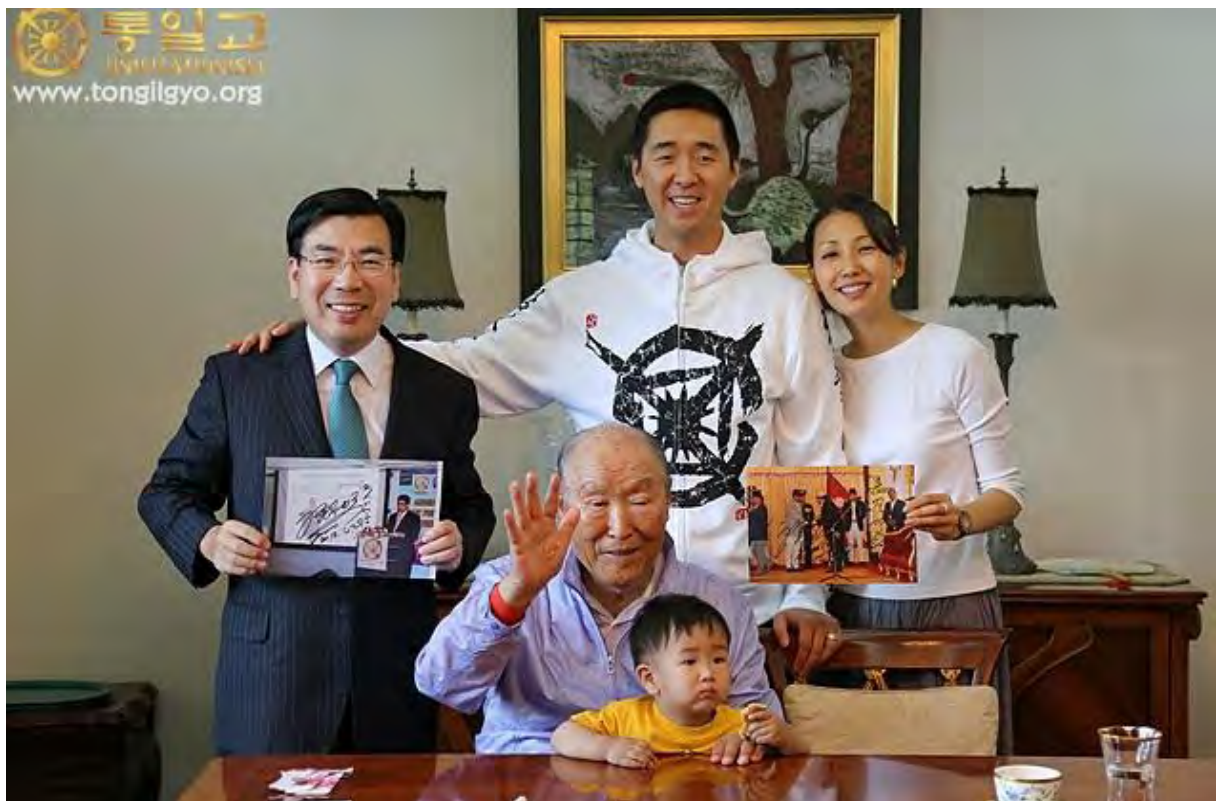
Commemorative photo after reporting Ek Nath Dhakal national leader of Nepal became a current minister

Please inscribe the importance of lineage in your hearts. I cannot emphasize this enough. Without lineage, neither life nor love can endure. You strive to set a good tradition, but it will endure only through your lineage. Lineage is the bridge allowing the parents' spirit to carry on through subsequent generations. In other words, lineage is the first and final condition necessary for parents to harvest the fruits of their love, the fruits of their life and the fruits of their joy. We need to know this with certainty. - Speech of the founding of the Universal Peace Federation, The Importance of Lineage