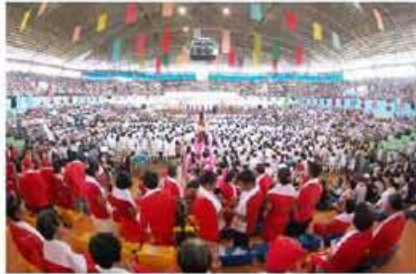
▲ 필리핀 솔탄부다르주에서 '초종교평화축복축제'가 열리고 있다.

[천지일보=이일성 기자] 지난날 31일 필리핀 만다리오 섬 솔탄부다르주에서 '초종교평화축복축제'가 열렸다.