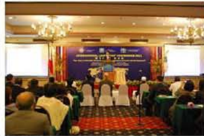
▲ 문국진 회장이 대한민국의 경제 주체로 특별강연을 하고 있다.

이 지도자 회의에서는 세계의 경제가 또 다른 절망의 지도자들이 모여서 평화와 발전을 위한 모델 사례를 공유했다. 문국진 회장님을 포함한 '대한민국'이라는 주제의 특별강연에서 "중국의 군사력 증강을 공포정치하여 아시아의 평화를 대두"는 메시지를 제시했다.