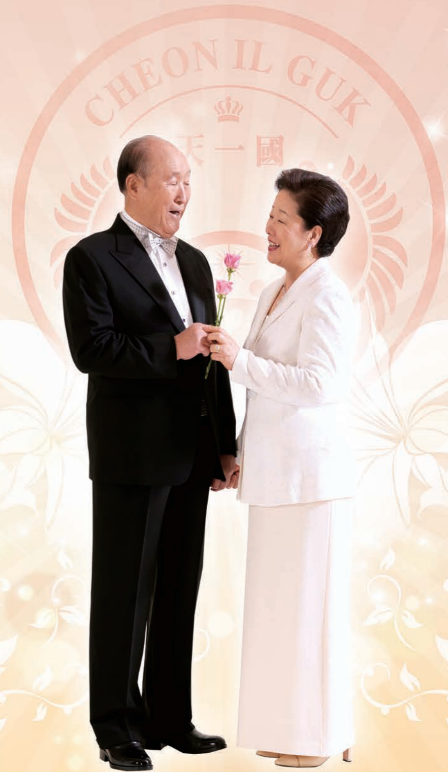
천지인참부모님 天地人眞の父母様 True Parents of Heaven, Earth and Humankind

Heavenly Parent! May glory be to heaven, May praise and worship fill all corners of the earth. Heavenly Parent, we are so grateful. You have toiled for so long. We are fully aware that even though we are unworthy to stand before you on this day of great blessings and grace, Heaven has broadly and profoundly embraced us once again. Father, how can we keep this grace and profound inspiration solely to ourselves. Heavenly Parent! We tell you this, until the day we ascend, We promise and resolve to invest ourselves entirely and advance the completion of Cheon Il Guk. From True Mother's Prayer during the Coronation Ceremony for the True Parents of Heaven, Earth and Humankind and the Cosmic Registration Blessing Ceremony