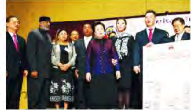
19일 미국종교치도 사람의 및 큰 파란스에서 참석차들이 참사할 운동에 동참하겠다는 요지의 성명서에 사안하고 한 다 총계에게 전달한 뒤, 함께 기념을 향용 하고 있다.

이날 참석자들은 ACLC 회원 1700여명 진원의 뜻을 모아 발표한 특별 성명을 통해 "문성명·한학자 총재 내외분은 종교, 국