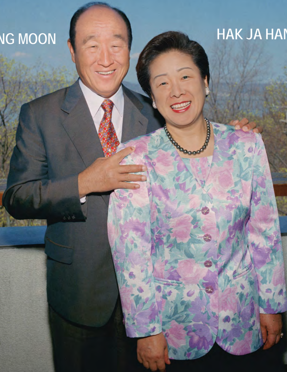
HAK JA HAN